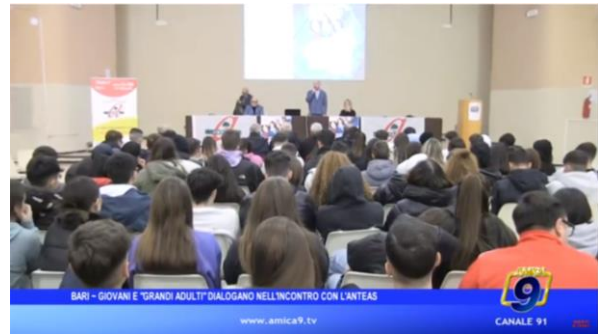
BARI - GIOVANI E "GRANDI ADULT" DIALOGANO NELL'INCONTRO CON L'ANTEAS

Amica 9 TV https://www.youtube.com/watch?v=NX2aoD-rnUk