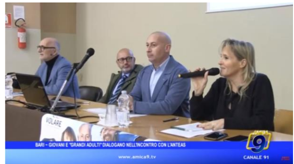
BARI - GIOVANI E "GRANDI ADULT" DIALOGANO NELL'INCONTRO CON L'ANTEAS